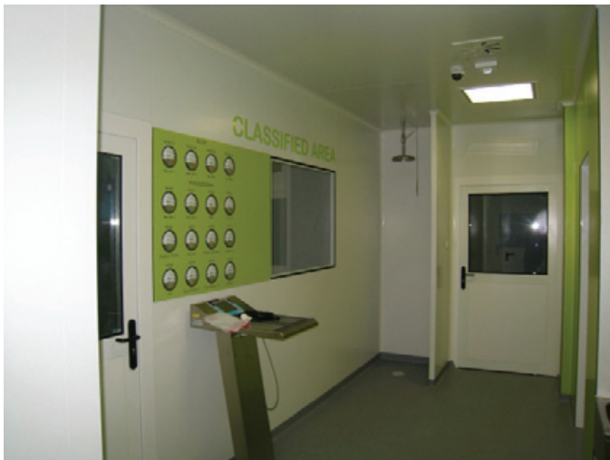
FOT. 3, 4

Firma BART zamontowała systemy wentylacji mechanicznej i klimatyzacji precyzyjnej w farmaceutycznych pomieszczeniach czystych, w których występowało promieniowanie jonizujące. Firma zainstalowała w nich cztery układy wentylacyjne o łącznej wydajności ok. 25 000 m 3 /h. Projekt dotyczył pomieszczeń o klasie czystości B, C, D z zachowaniem norm GMP